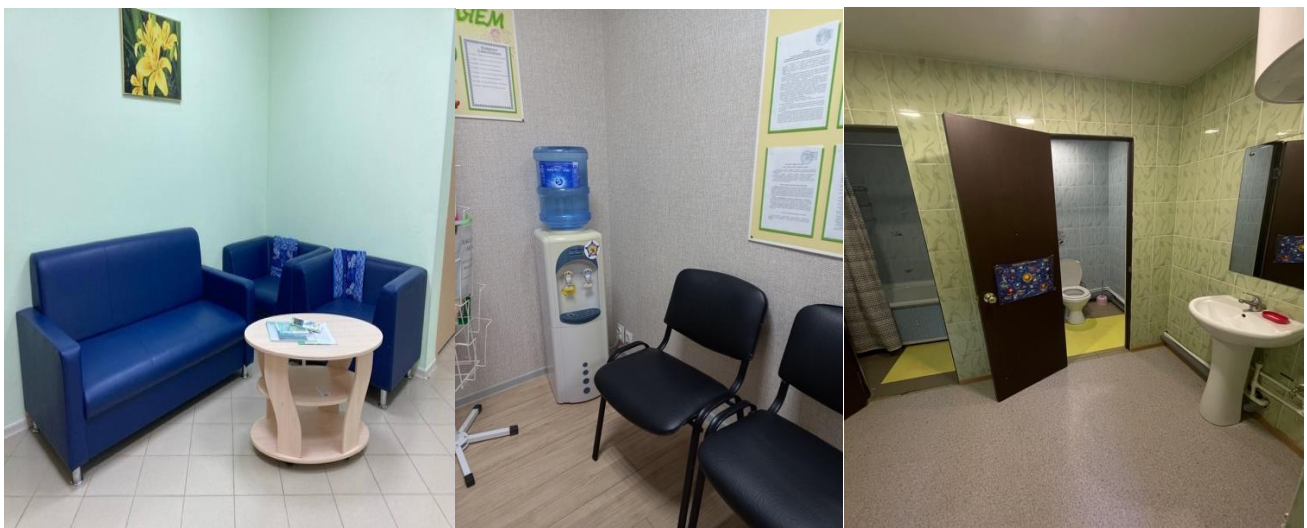
Фото мест ожидания, доступности питьевой воды и состояние санитарно-гигиенический помещений в организациях социального обслуживания Пермского края.

Максимальные баллы (100 баллов) по данному критерию показали следующие организации: ГКУСО ПК «Центр помощи детям, оставшимся без попечения родителей» Ильинского района; ГКУСО ПК «Центр помощи детям, оставшимся без попечения родителей» г. Перми; ГКУСО ПК «Центр помощи детям, оставшимся без попечения родителей» г. Краснокамска; ГКУСО ПК «Осинский дом-интернат «Солнечный»; ГКУСО ПК «Центр помощи детям, оставшимся без попечения родителей» г. Чайковского; ГКУСО ПК «Центр помощи детям, оставшимся без попечения родителей» г. Березники; ООО «УК «Новолетие».