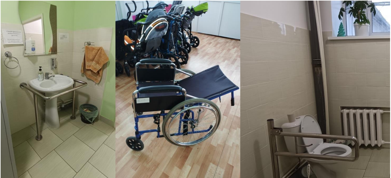
Фото доступности услуг для инвалидов в организациях социального обслуживания Пермского края.

Максимальные баллы по данному критерию были представлены ГКУСО ПК «Осинский дом-интернат «Солнечный». В данной организации было обеспечено наличие оборудованных входных групп пандусами (подъемными платформами; наличие адаптированных лифтов, поручней, расширенных дверных проемов; наличие сменных кресел-колясок; наличие специально оборудованных санитарно-гигиенических помещений в организации социальной сферы), а также полностью обеспечены условия доступности, позволяющих инвалидам получать услуги наравне с другими.